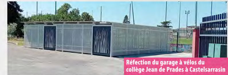
Réfection du garage à vélos du collège Jean de Prades à Castelsarrasin