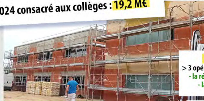
Extension des collèges de Labastide-Saint-Pierre (en haut) et de Montech (en bas)

budget 2024 consacré aux collèges : 19,2 M€