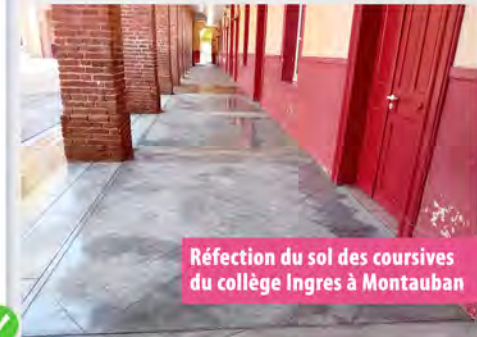
Réfection du sol des coursives du collège Ingres à Montauban