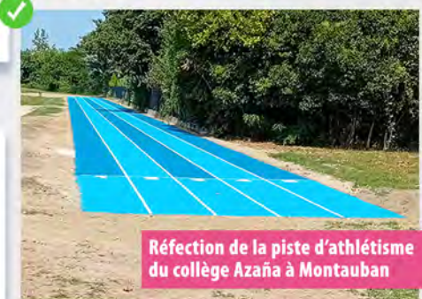
Réfection de la piste d'athlétisme du collège Azaña à Montauban