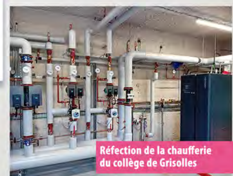
Réfection de la chaufferie du collège de Grisolles

Plus de renseignements sur le site tarnetgaronne.fr