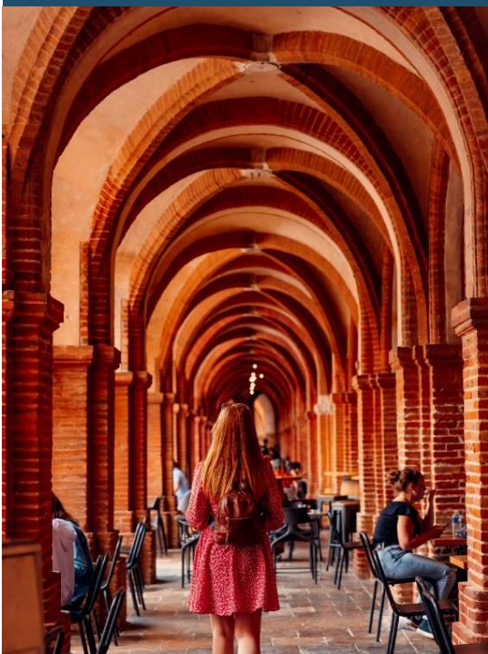
Schéma départemental du tourisme durable du Tarn-et-Garonne 2023-2028 Plan d'actions